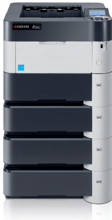
Abbildung mit Optionen.

Mit einer Geschwindigkeit von bis zu 60 Seiten pro Minute ist der A4-SW-Laserdrucker FS-4300DN ideal für alle, die nach maximaler Leistungsfähigkeit suchen. Dabei muss auf extrem niedrige Druck- und Energiekosten nicht verzichtet werden, im Gegenteil: Der FS-4300DN lässt in puncto geringe Betriebskosten die Konkurrenz hinter sich und erzielt die günstigsten Druckkosten seiner Klasse. Große Arbeitsgruppen mit hohem Druckaufkommen profitieren von seiner Leistungsstärke, Zuverlässigkeit, Ausstattung und Bedienfreundlichkeit.